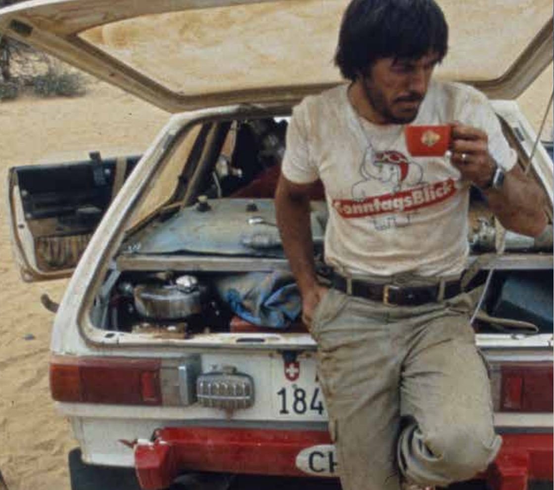
Bernhard Russi, Rallye Paris-Dakar, 1982