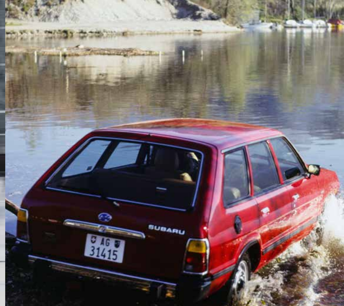
Subaru 1800 Station 4WD, 1982