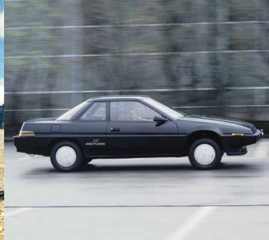
Subaru XT 4WD Turbo, 1985