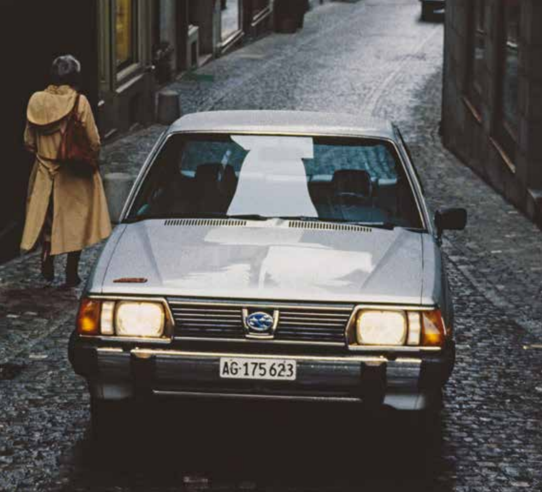
Subaru 1800 Turismo 4WD, 1981