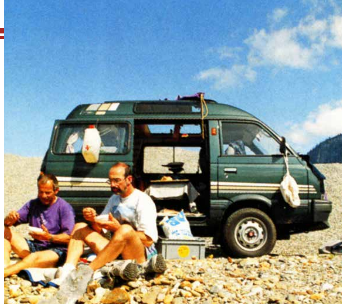
René Däppen, Uetendorf BE, 1993

Öffnungszeiten, Eintrittspreise, Infos zu Führungen und weitere Informationen finden Sie unter: www.emilfreyclassics.ch