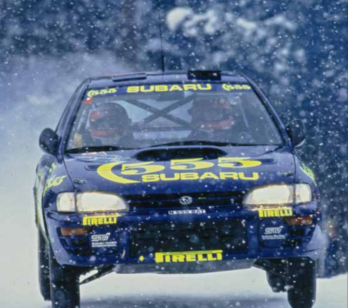
Didier Auriol / Bernard Occelli, Schweden Rallye, 1996