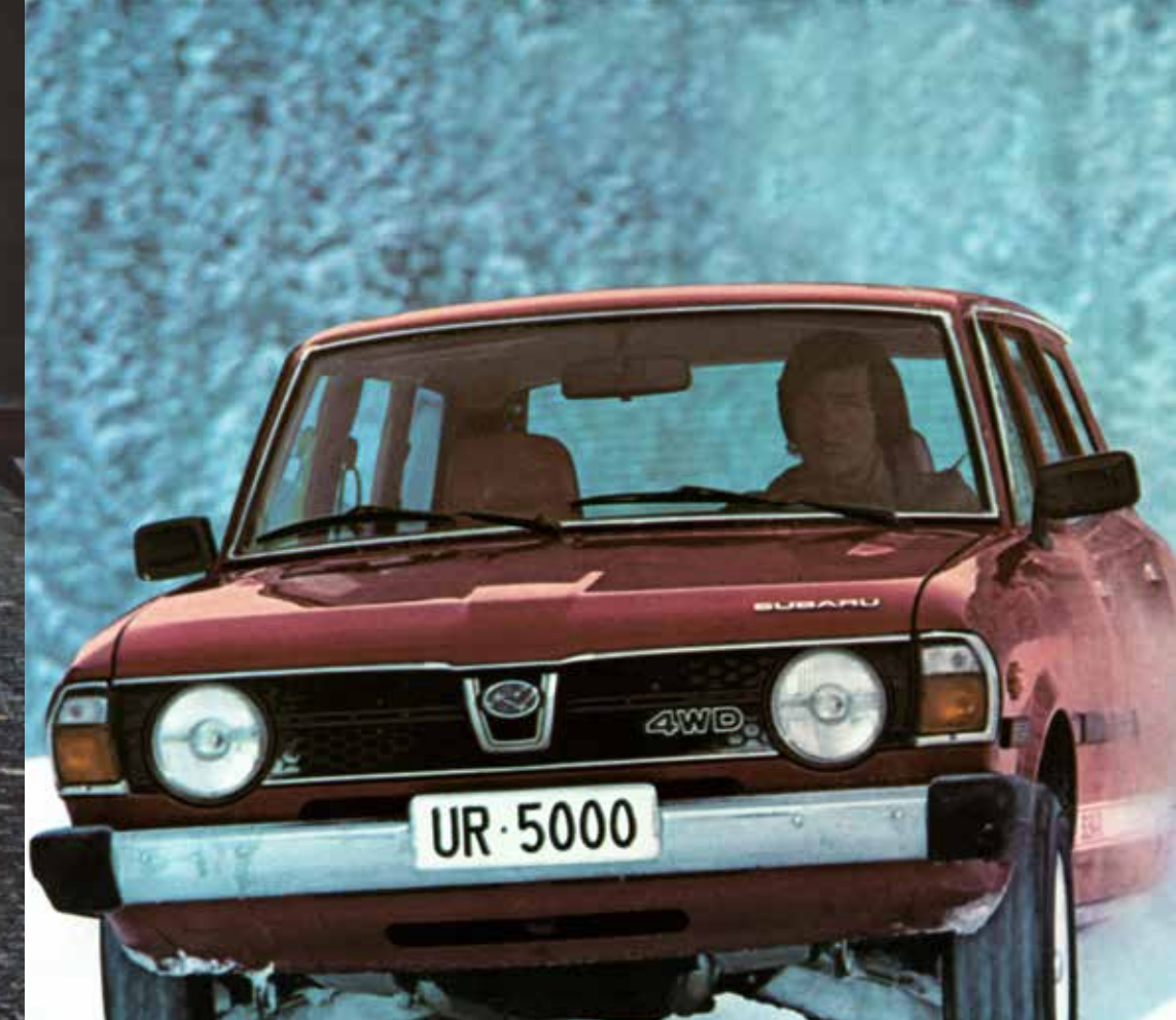
Erster Subaru-Werbespot in der Schweiz, 1979