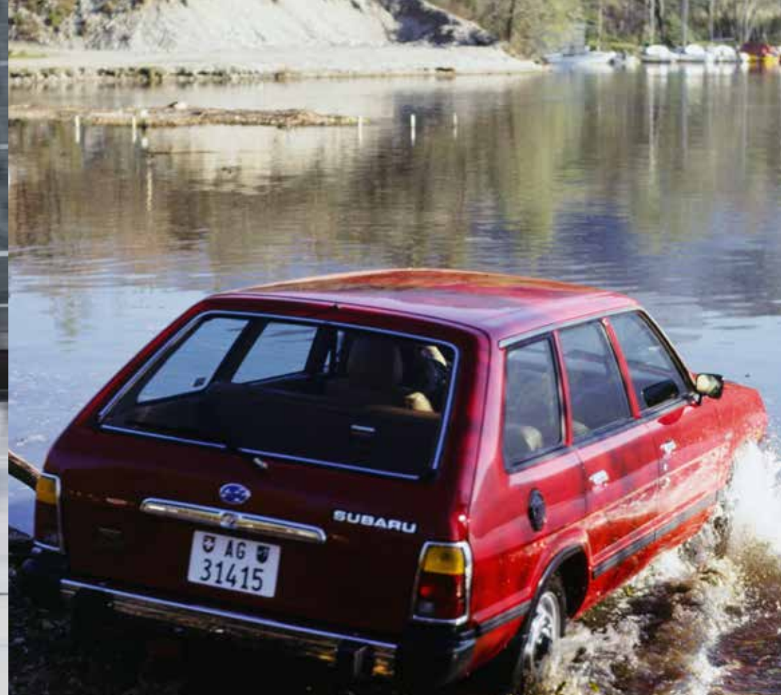
Subaru 1800 Station 4WD, 1982