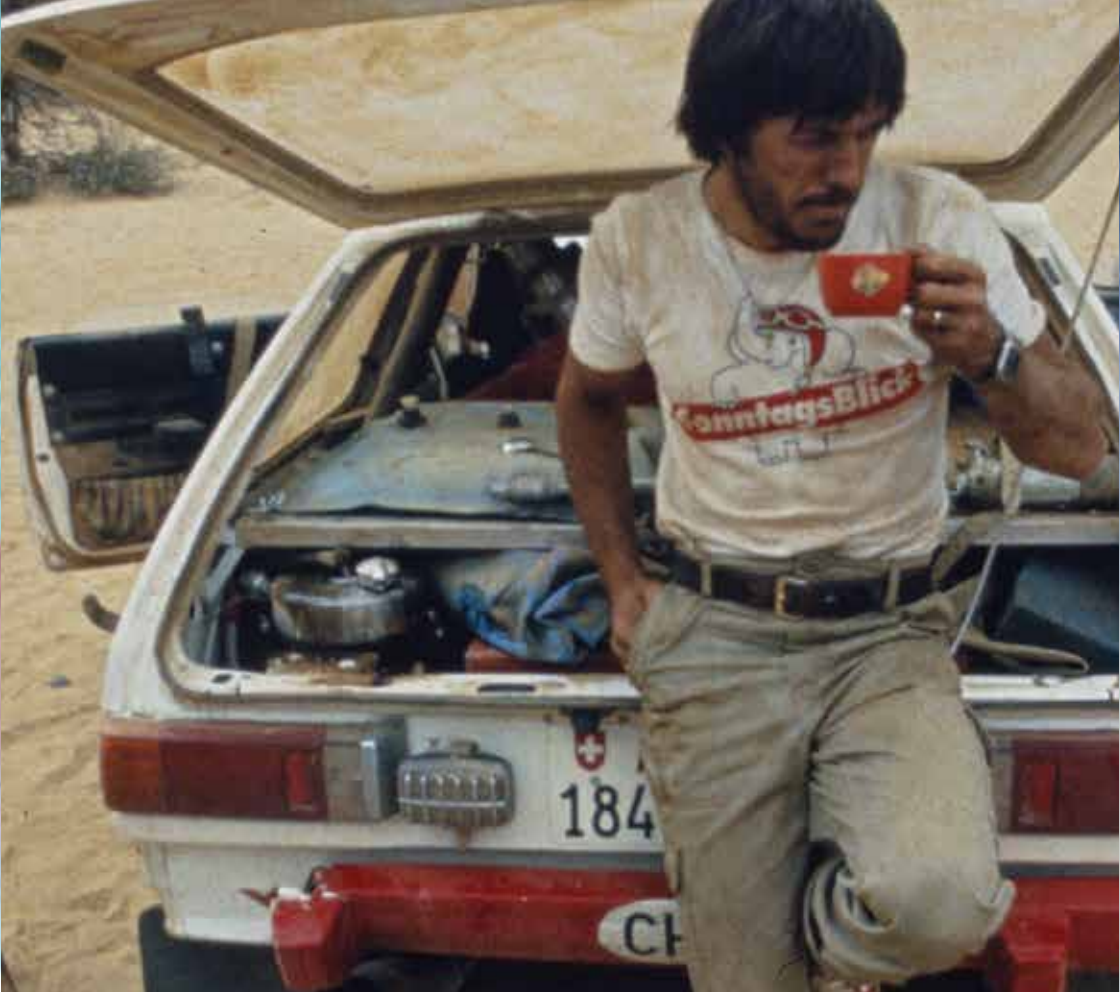
Bernhard Russi, Rallye Paris-Dakar, 1982